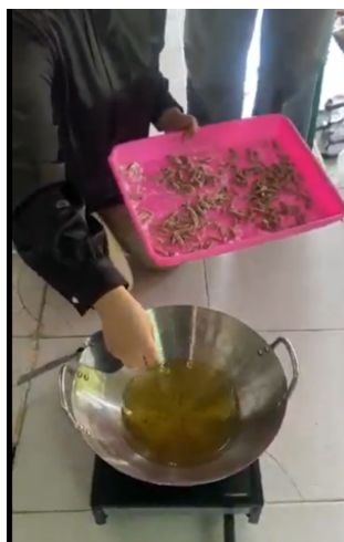
Gambar 3. Pembuatan Kue Bawang dari Tepung Ikan Teri

Tepung ikan teri yang sudah jadi kemudian dicampurkan ke dalam adonan kue bawang bersama tepung terigu, telur, margarin, bawang putih halus, garam, dan bumbu pelengkap. Adonan diuleni hingga kalis, dipipihkan, lalu dipotong memanjang sesuai bentuk kue bawang. Potongan adonan digoreng dalam minyak panas hingga berwarna keemasan, kemudian didinginkan dan dikemas dalam wadah tertutup rapat. Dengan tambahan tepung ikan teri, kue bawang yang dihasilkan memiliki cita rasa gurih khas laut serta kandungan protein yang lebih tinggi dibandingkan kue bawang biasa.