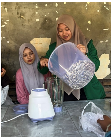
Gambar 2. Pembuatan Terasi Ikan Teri

Adonan hasil fermentasi kemudian dihaluskan menggunakan blender atau chopper agar teksturnya lebih seragam dibandingkan cara manual. Adonan yang telah halus dijemur di atas tampah bambu selama 2–3 hari hingga setengah kering, lalu difermentasi kembali 2–4 minggu untuk menghasilkan aroma khas terasi. Tahap akhir adalah pencetakan sesuai ukuran, penimbangan, dan pengemasan ke dalam plastik berlogo agar lebih tahan lama dan siap dipasarkan.