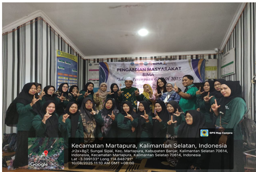
Gambar 2. Foto Bersama

test menjadi 70% pada post-test . Hal ini menunjukkan bahwa perempuan di desa memiliki potensi adaptif terhadap teknologi, asalkan diberikan akses dan pelatihan yang sesuai. Pemasaran digital menjadi strategi penting dalam memperluas jangkauan usaha mikro perempuan, terutama di masa pascapandemi, di mana transaksi daring menjadi lebih dominan. Studi oleh Azmiyannoor et al. (2021) menegaskan bahwa literasi digital menjadi pengungkit daya saing UMKM perempuan, namun masih sangat terbatas pada wilayah pedesaan di Indonesia (Azmiyannoor et al. , 2021; Rahman et al. , 2019).