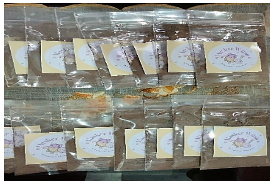
Gambar 2. Produk Masker Wajah

Setelah para peserta mengetahui proses pembuatan masker wajah alami,