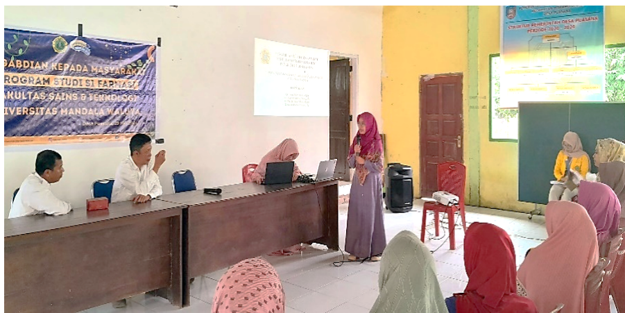
Gambar 1. Presentasi Materi Pembuatan Masker Wajah

Selama proses penyuluhan dilakukan, warga desa puasana sangat antusias dalam menerima materi yang diberikan, dan tidak sedikit juga dari warga yang memberikan pertanyaan terkait cara pembuatan dan pemakaian masker wajah alami. Adapun kendala yang didapatkan selama penyuluhan yaitu keterbatasannya waktu karena warga desa puasana banyak yang memiliki aktivitas lainnya.