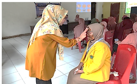
Gambar 3. Penggunaan Masker Wajah

kemudian masker tersebut dicobakan pada 1 orang probandus.