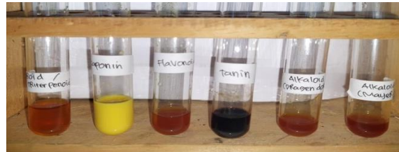
Gambar 1. Skrining Fitokimia Reaksi Warna

flavonoid yang menghasilkan noda berwarna coklat ketika disemprot dengan penampak noda amoniak dan dipertegas dengan visual warna kehijauan ketika diamati pada sinar UV 254 . Hasil skrining fitokimia dengan reaksi warna dan KLT dapat dilihat pada Gambar 1 dan 2.