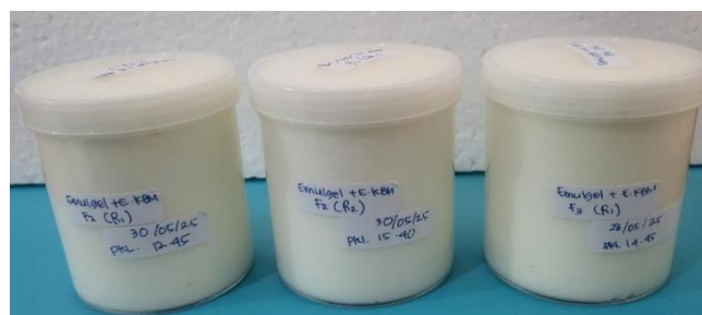
Gambar 3. Emulgel Tabir Surya Ekstrak Kulit Buah Manggis

pengujian. Gambar sediaan emulgel tabir surya ekstrak kulit buah manggis dapat dilihat pada Gambar 3.