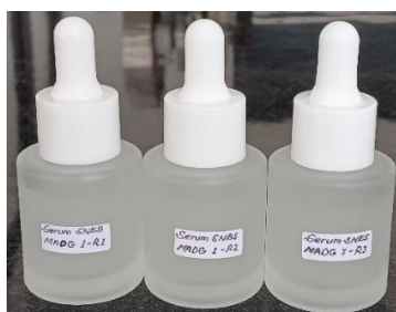
Gambar 4. Hasil Formulasi Anti-aging Serum SNES MADG

homogen (F-Serum-SNES-1, F-Serum-SNES-2, F-Serum-SNES-3), menunjukkan kompatibilitas SNES MADG dengan bahan pembawa ( aloe vera gel, gliserin, aquabidest ).