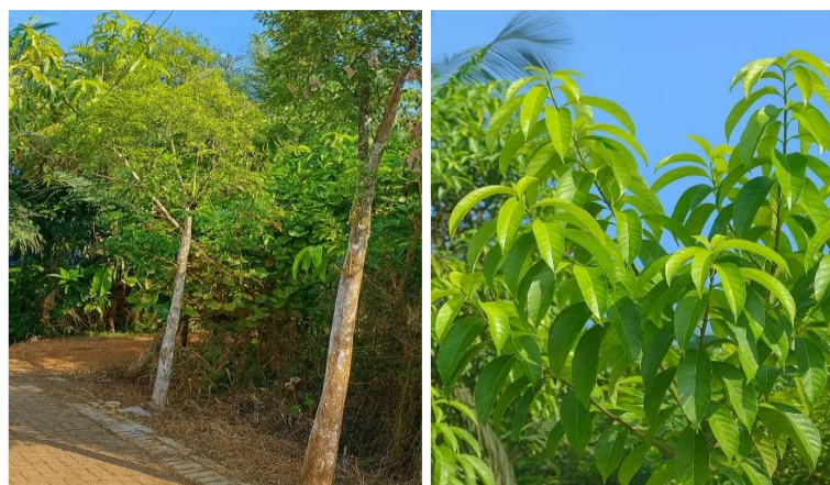
Gambar 1. Tanaman Gaharu

Tanaman gaharu ( Aquilaria malaccensis Lamk.) merupakan spesies dari famili Thymelaeaceae yang dikenal memiliki berbagai aktivitas biologis, termasuk antioksidan, tabir surya, antimikroba, antiinflamasi, dan antikanker. Komponen bioaktif utama yang ditemukan dalam daun gaharu meliputi flavonoid, alkaloid, terpenoid, saponin, tanin, dan steroid, di mana flavonoid dan terpenoid berperan penting dalam aktivitas penangkal radikal bebas. Analisis GC-MS menunjukkan kandungan senyawa seperti \beta -bisabolene, trans-kariofilen, \alpha -copaene, serta asam palmitat, yang berkontribusi pada aktivitas antioksidan dan tabir surya. Berdasarkan uji DPPH (2,2-dipenil-1-pikrilhidrazil), ekstrak daun gaharu memiliki nilai IC 50 antara 27-47 ppm, menunjukkan aktivitas antioksidan yang sangat kuat, lebih tinggi dibandingkan banyak herbal tropis lainnya (Sufaati et al. , 2024; Ulfah et al. , 2021). Studi SPF ekstrak daun gaharu melaporkan nilai SPF 2,85-6,21 mengindikasikan proteksi minimal-sedang (Ulfah et al. , 2021).