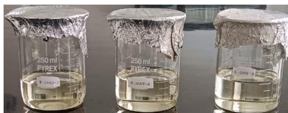
Gambar 3. Hasil Formulasi SNES MADG

Penambahan kosurfaktan digunakan untuk mengurangi tegangan antarmuka bersama surfaktan dan meningkatkan fleksibilitas lapisan minyak dalam air untuk membentuk nanoemulsi spontan. Berdasarkan penelitian sebelumnya, PEG 400 telah digunakan dalam pembuatan SNE andrografolid dengan ukuran partikel 12 nm dan zeta potensial -46,3 mV (Syukri et al. , 2018).